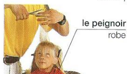
couper cut (v)