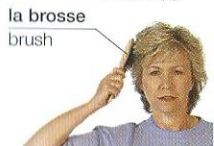
brosser | brush (v)