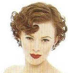
faire une mise en plis set (v)