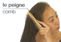
peigner comb (v)