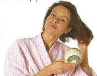
sécher blow dry (v)