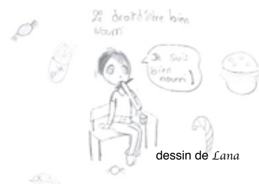
dessin de Lana