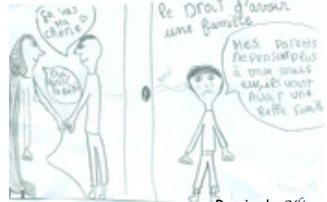
Dessin de Céline