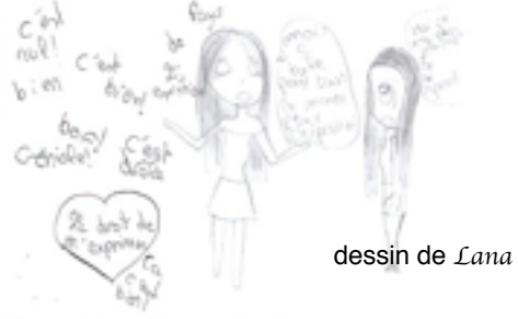
dessin de Lana