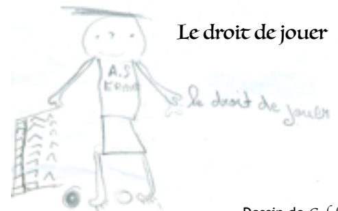
Dessin de Caleb