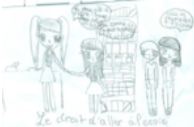
Dessin de Hyéléna