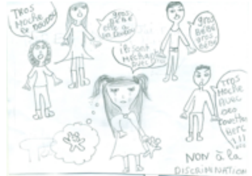
Dessin de Céline