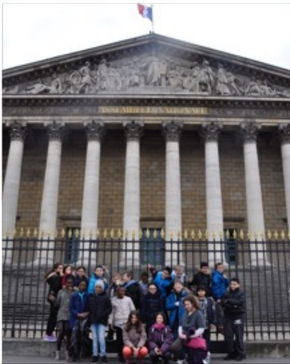
La classe visite l'Assemblée nationale

Fonction : Rôle exercé par quelqu'un au sein d'un groupe, d'une activité