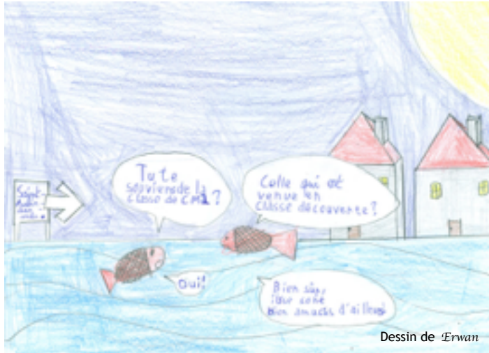
Dessin de Erwan

Les CM2 de chez Mme Godin sont allés en classe de découverte à St-Aubin-Sur-Mer en Normandie du 9 au 13 mars. Nous vous présentons notre classe de découverte en Normandie jour après jour.