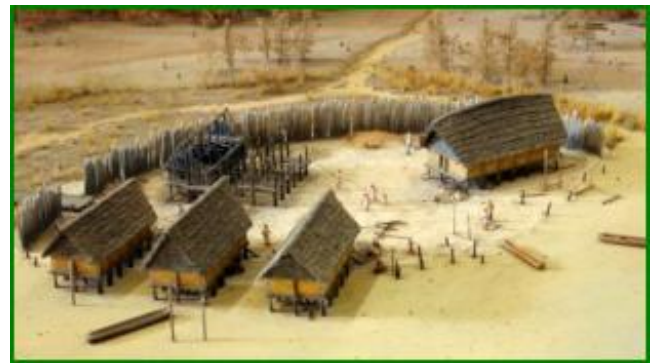
un village au néolithique

Le fait de construire des villages s'accompagne de la fabrication d' outils spécifiques pour de nouvelles activités : le fissage et la poterie naissent, qui permettent, l'un d'utiliser les fibres produites (la laine , ou le chanvre par exemple), l'autre de stocker les boissons et la nourriture.