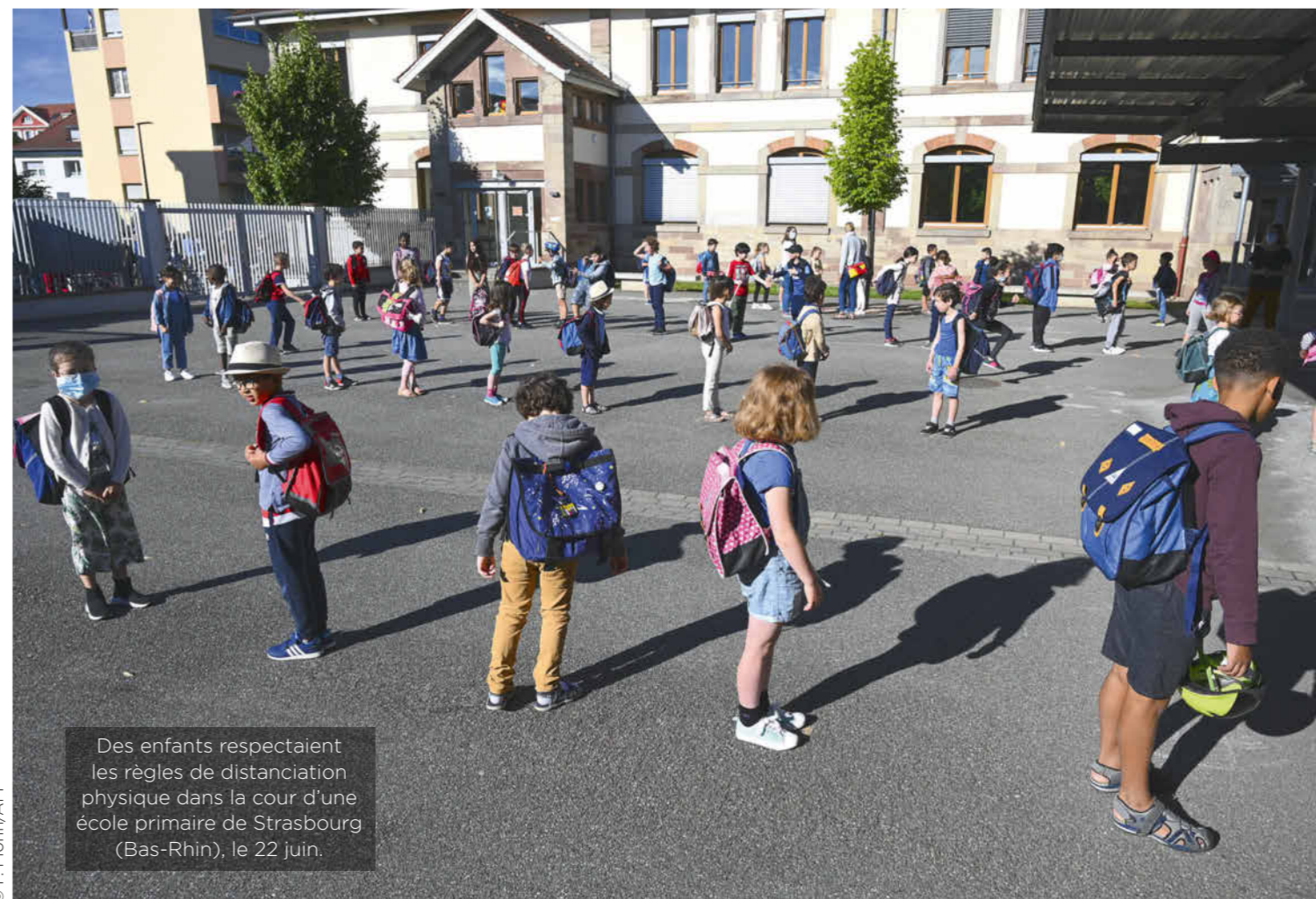
Des enfants respectaient les règles de distanciation physique dans la cour d'une école primaire de Strasbourg (Bas-Rhin), le 22 juin.