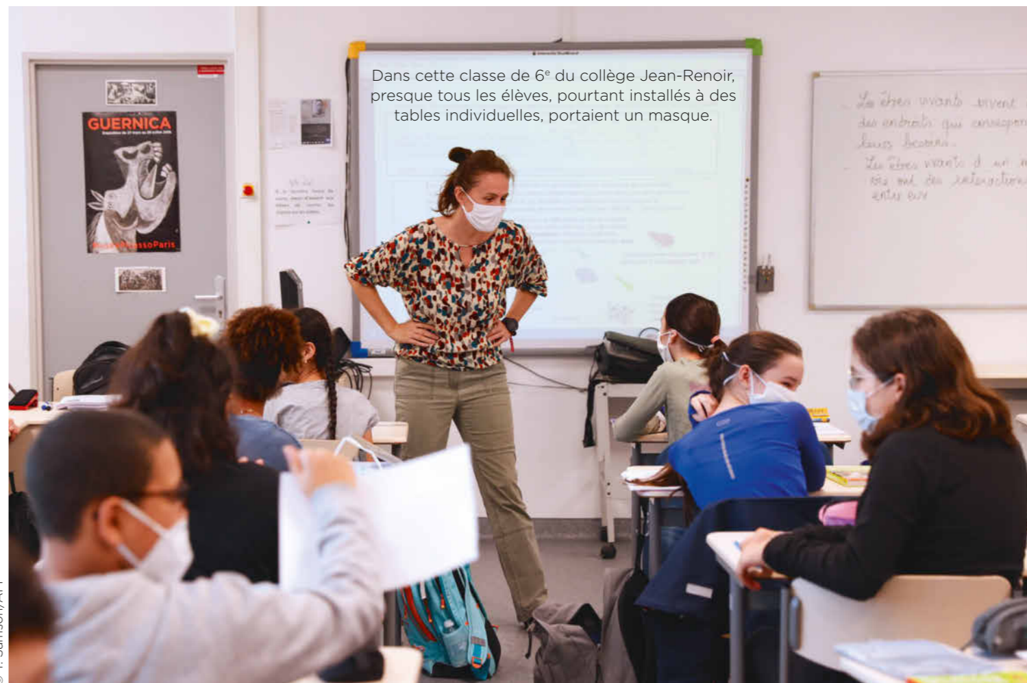
Dans cette classe de 6 e du collège Jean-Renoir, presque tous les élèves, pourtant installés à des tables individuelles, portaient un masque.