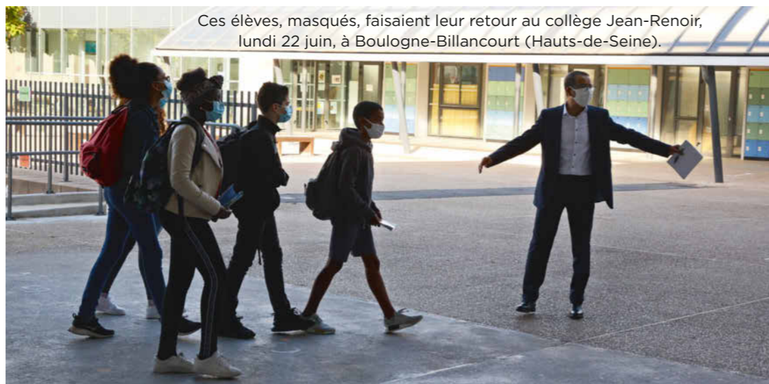
Ces élèves, masqués, faisaient leur retour au collège Jean-Renoir, lundi 22 juin, à Boulogne-Billancourt (Hauts-de-Seine).