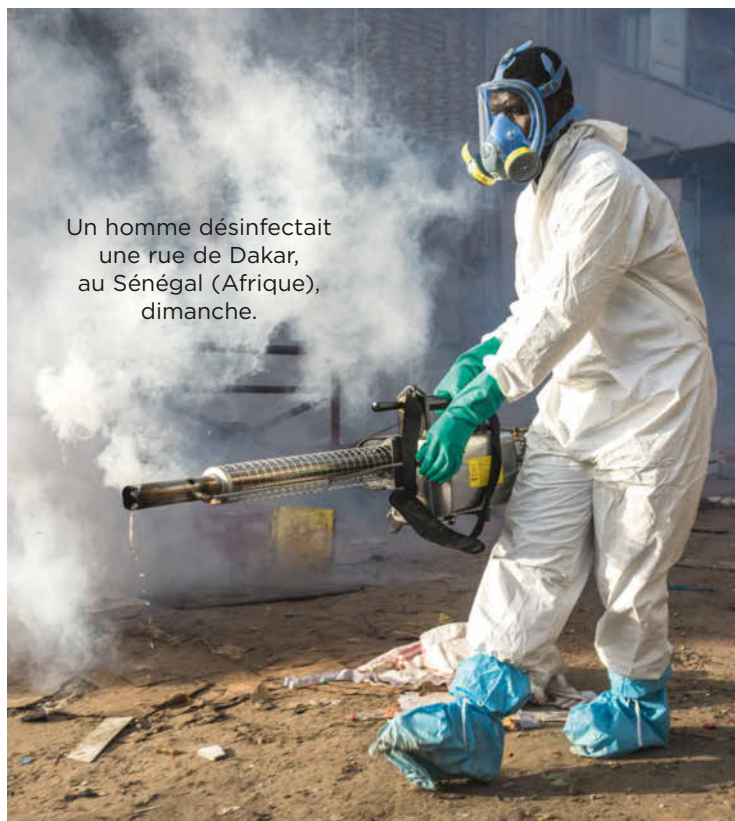
Un homme désinfectait une rue de Dakar, au Sénégal (Afrique), dimanche.

Combien d'habitants l'Afrique compte-t-elle, au total ?