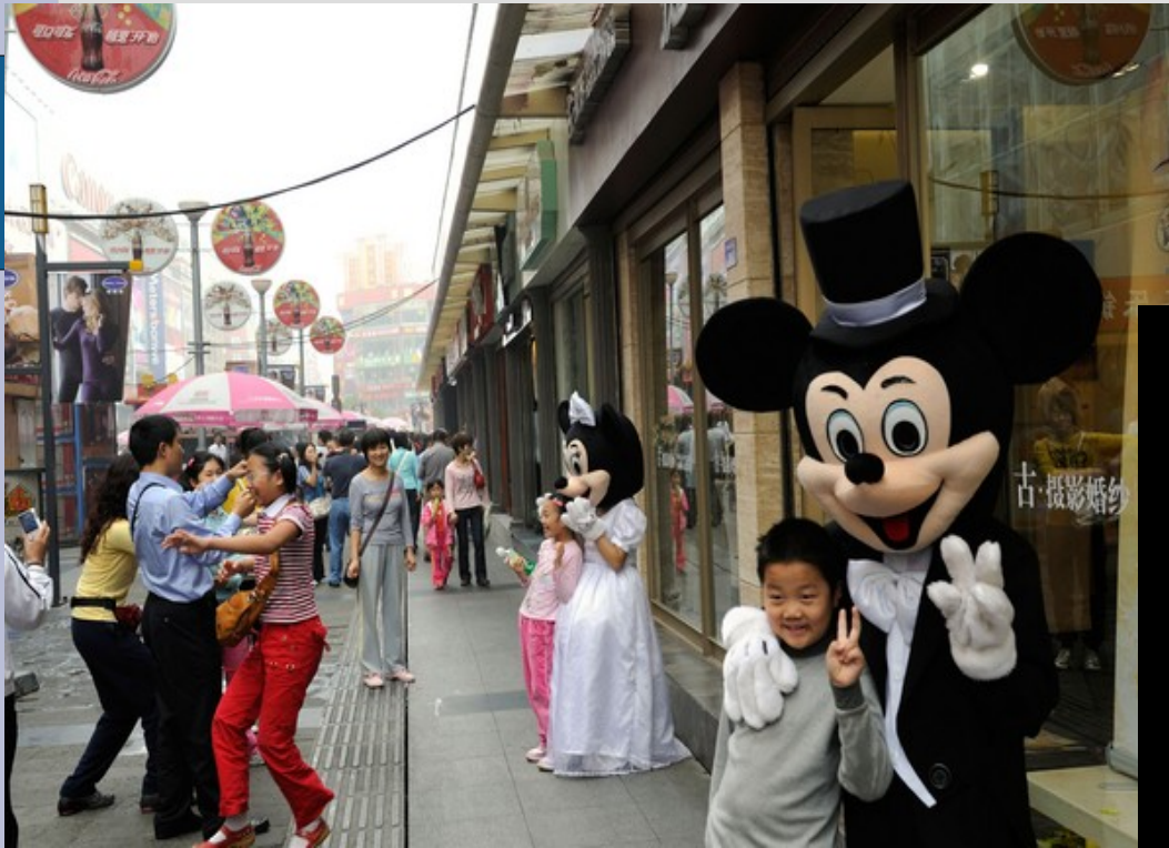
Photographie prise en Chine, à Chengdu

Drapeau américain brûlé ds les territoires palestiniens