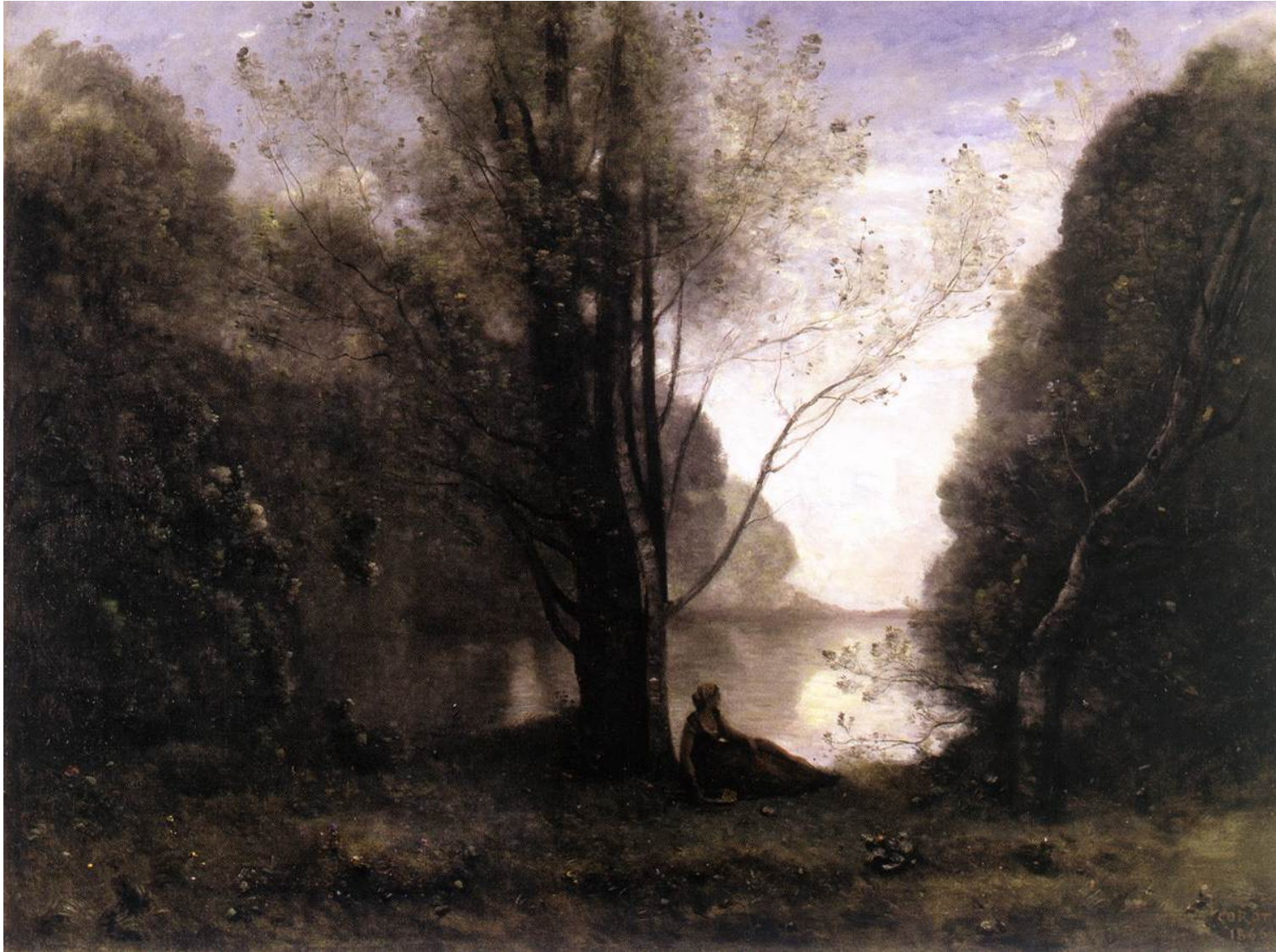
Jean-Baptiste Corot, Solitude (1866)

Composer un poème sur le tableau de Corot