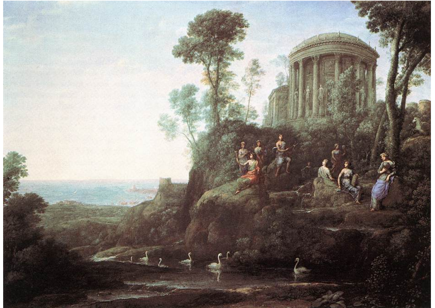
Claude Lorrain, Apollon et les muses sur le mont Hélicon , 1680

- Soit cet invisible relève des forces qui régissent l'univers , du divin, et le poète se conçoit comme une sorte de prêtre.