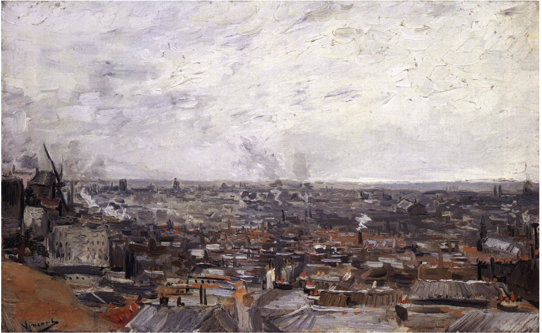
Vincent Van Gogh, Vue de Paris depuis Montmartre , 1886