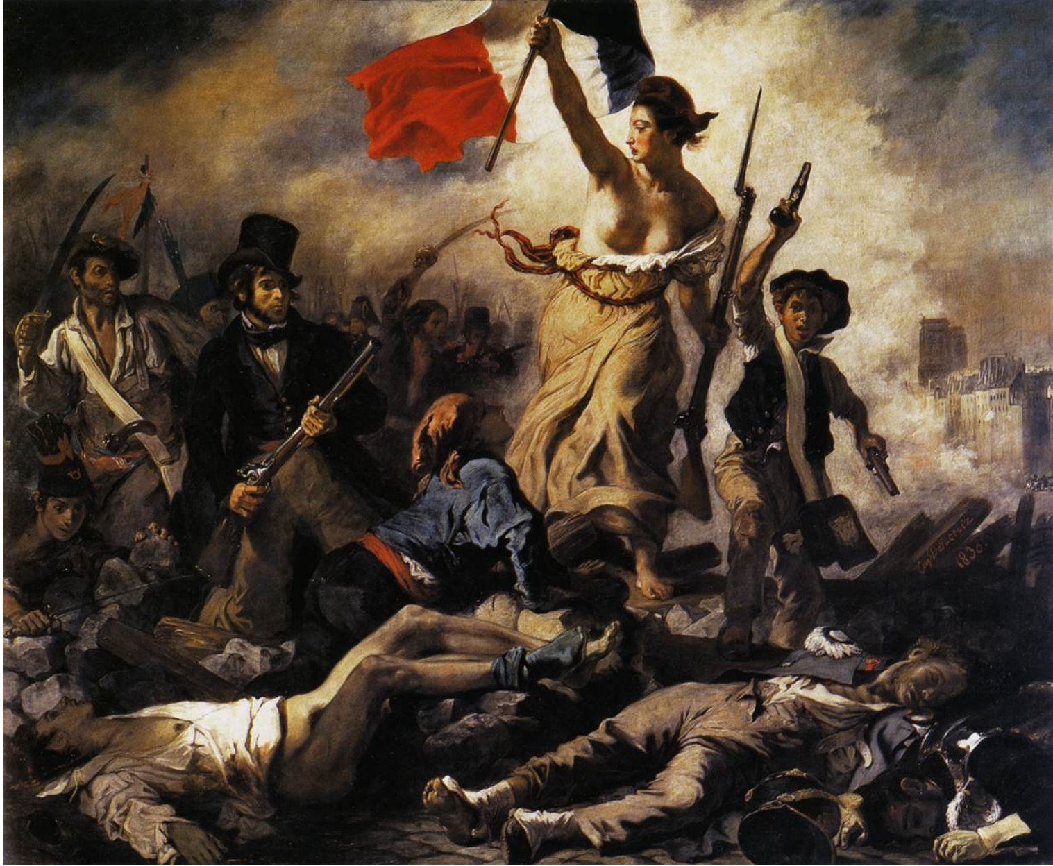
Delacroix, La Liberté guidant le peuple , 1830