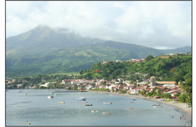
Saint-Pierre de Martinique.

La Martinique, la Guadeloupe et La Réunion sont trois grandes îles sur lesquelles il y a des volcans en activité. Sur ces îles, on cultive des fruits exotiques comme les bananes, les ananas, les fruits de la passion... qui sont expédiés en métropole et dans différents pays du monde. On y cultive aussi la canne à sucre qui sert à produire du sucre et à fabriquer du rhum.