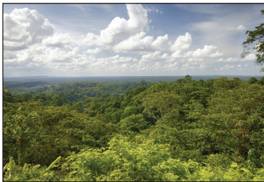
La forêt tropicale en Guyane.

La Nouvelle-Calédonie est constituée d'un ensemble de petites îles qu'on appelle un « archipel », dont la ville principale est Nouméa. Toutes ces îles reçoivent beaucoup de vacanciers qui sont attirés par la chaleur, les paysages magnifiques, les plages de sable fin entourées d'eaux bleu turquoise... Ainsi, le travail des habitants est très souvent en rapport avec le tourisme.