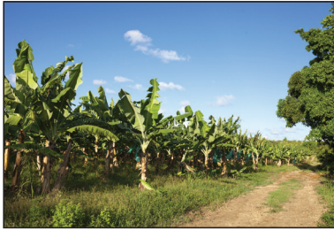
Une plantation de bananes.

La Martinique, la Guadeloupe et La Réunion sont trois grandes îles sur lesquelles il y a des volcans en activité. Sur ces îles, on cultive des fruits exotiques comme les bananes, les ananas, les fruits de la passion... qui sont expédiés en métropole et dans différents pays du monde. On y cultive aussi la canne à sucre qui sert à produire du sucre et à fabriquer du rhum.