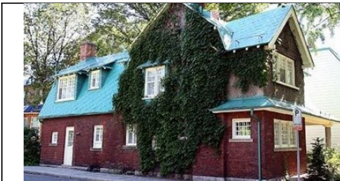
Maison de style Arts and Crafts (lucarnes rampantes, toit à double versant et portes de différentes dimensions) Architecte Edward Black Staveley, Quebec.

Classification des arts : art 1 er : l'architecture, 2 nd : la sculpture, puis la peinture, la musique, la poésie, les arts de la scène (danse, mime, théâtre, cirque...), 7 em art : le cinéma, 8 em : les arts médiatiques (radio, télé, photo) et enfin le 9 em art : la bande dessinée.