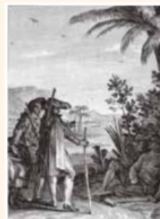
Voltaire, Candide ou l'Optimisme , 1759.

– Oui, monsieur, dit le nègre, c'est l'usage. On nous donne un caleçon de toile pour tout vêtement deux fois l'année. Quand nous travaillons aux sucreries, et que la meule nous attrape le doigt, on nous coupe la main ; quand nous voulons nous enfuir, on nous coupe la jambe : je me suis trouvé dans les deux cas. C'est à ce prix que vous mangez du sucre en Europe.