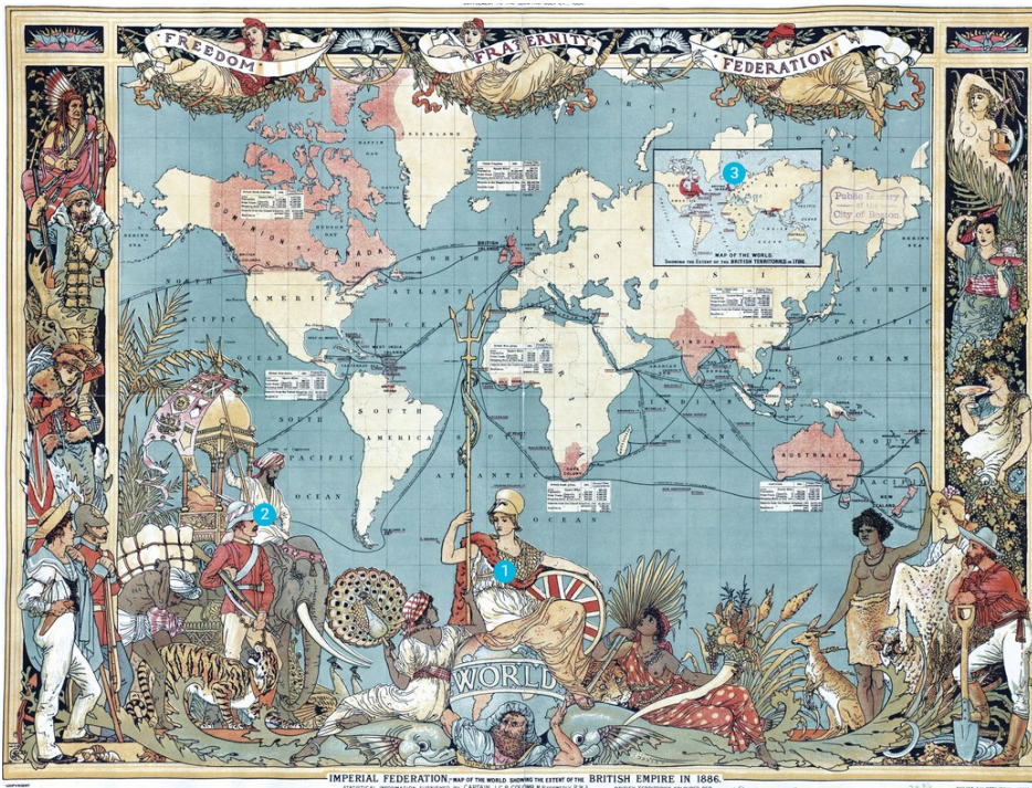
Dessin de Walter Crane d'après une carte de J. Colons, 1886.