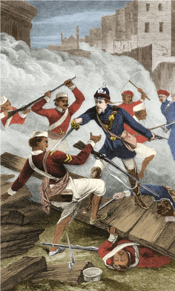
Gravure de 1858

Les conquêtes coloniales se heurtent à des résistances actives de la part des populations locales, puis à des révoltes contre l'ordre colonial. Dans les Indes britanniques, les cipayes, des soldats indigènes, se révoltent en 1857. La révolte est écrasée dans le sang.