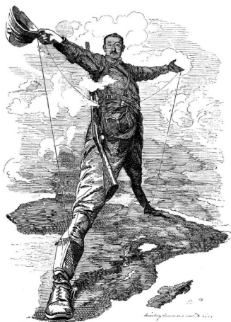
Cecil Rhodes est un homme d'affaires anglais. Il est premier ministre de la colonie du Cap en Afrique du Sud.