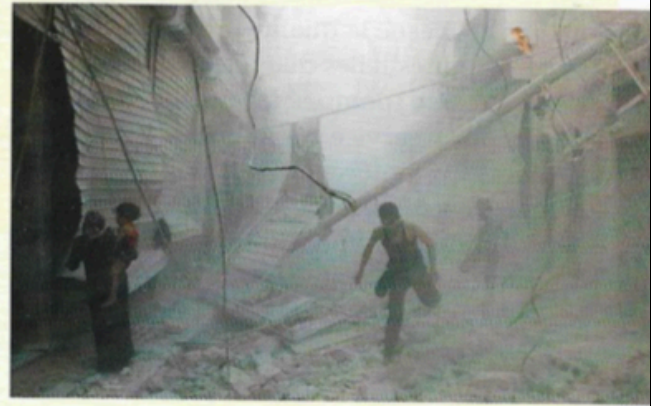
Alep, une ville sous les bombes, 2015.

En 2014, vivre à Alep devient intenable. « Ils étaient bombardés au quotidien. Ils ne pouvaient plus rester. J'ai entamé des démarches pour qu'ils me rejoignent en Suisse ». Une partie de la famille quitte la Syrie pour la Turquie et décide de prendre la mer pour rejoindre l'Europe. « On a payé une place pour un bateau pneumatique de quarante places pour aller en Grèce ». De là, ils rejoignent Stockholm en Suède après plusieurs semaines de démarche.