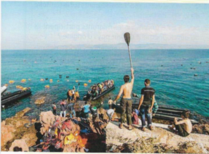
Traverser la Méditerranée sur des canots.