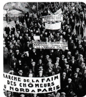
Marche de la faim de chômeurs du nord de la France, 1933.

En octobre 1929, les cours de la Bourse de New York (Wall Street) s'effondrent. Le système bancaire américain est durement atteint. Les États-Unis subissent une grave crise économique qui s'étend progressivement à partir de 1930 au reste du monde, notamment à l'Europe. Elle entraîne de nombreuses faillites d'entreprises et un chômage massif qui déstabilise les sociétés.