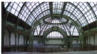
La révolution industrielle voit la création de nouveaux matériaux. L'acier est le matériau-roi, mais le style de référence reste le classicisme.