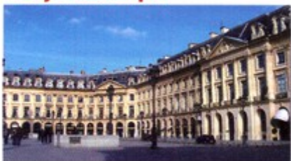
XVII e et XVIII e siècles. Le style classique fait toujours référence à l'Antiquité avec la découverte de Pompei et d'Herculanum.