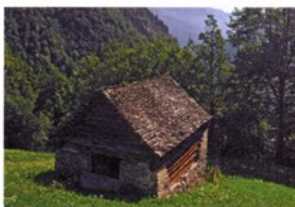
Estive, étable d'été en montagne, les Alpes.