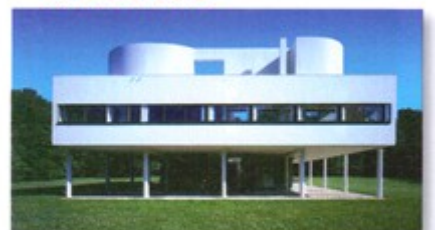
Le béton et les formes géométriques caractérisent l'architecture, même si tous les matériaux continuent d'être utilisés.