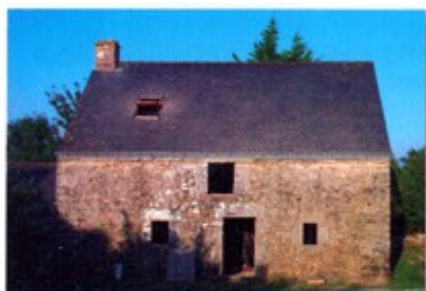
Maison en granite, Bretagne.