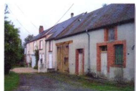
Ferme à entourage de briques, Creuse.