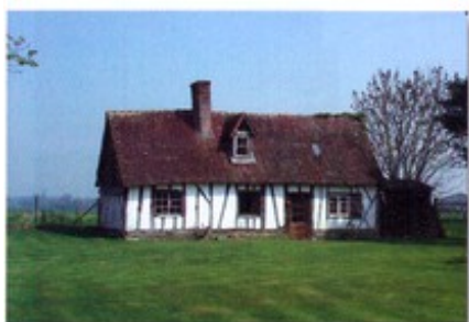
Maison à pans de bois, pays de Caux en Normandie.