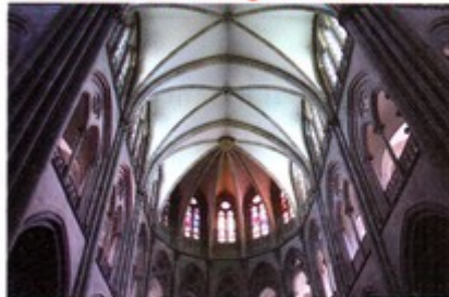
Du XII e au XIV e siècle. L'architecture gothique est caractérisée par l'utilisation de la voûte en ogive (arc brisé).