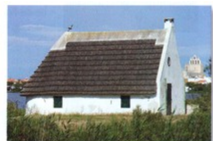
Habitat traditionnel, Camargue.