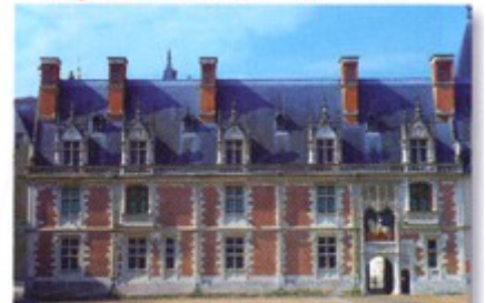
XVI e siècle. Le style Renaissance redécouvre l'Antiquité et met en valeur un art de vivre et d'habiter.