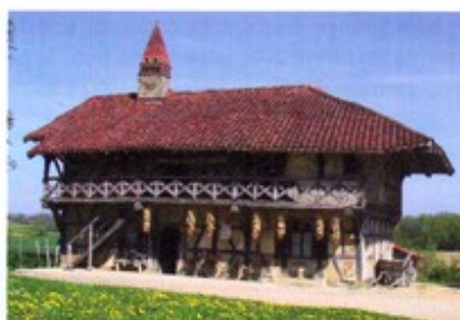
Maison à pans de bois, Bresse.