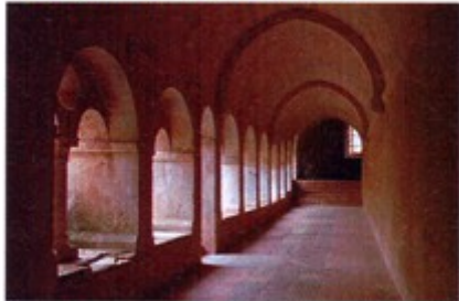
Du Moyen Âge jusqu'au XII e siècle. L'architecture romane est caractérisée par l'utilisation de la voûte en plein cintre (en demi-cercle).