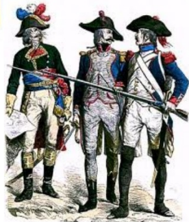
Don José (1865), Zuniga (1865), Moralès (1865)