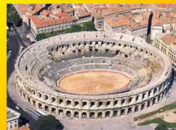
Arènes de Nîmes France

Ce ne sont pas, comme on le croit souvent, celles de Ronda qui datent de 1785. Les plus anciennes, toujours en activité, sont celles de Las Virtudes, à 20 km de Valdepenas, à 200 km au sud de Madrid. Elles datent de 1645.