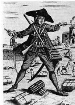
Mandrin et ses balotes de tabac Dessin anonyme (B.M., N.Y.)

Une loi interdisait par exemple à toute importer exporter ou transporter de l'alcool