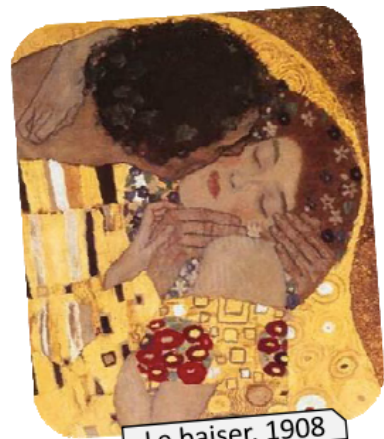
Le baiser, 1908