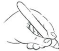
Posture normale : enfant gaucher

J'aide mon enfant à bien tenir son crayon et je le reprends systématiquement :