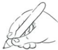
Posture normale : enfant droitier