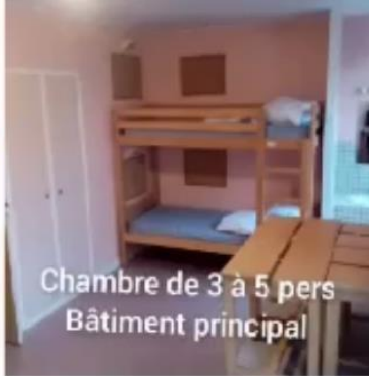
Chambre de 3 à 5 pers Bâtiment principal