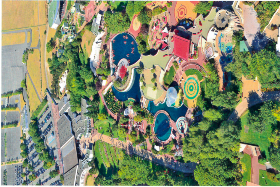
Le Futuroscope, près de Poitiers (Vienne).