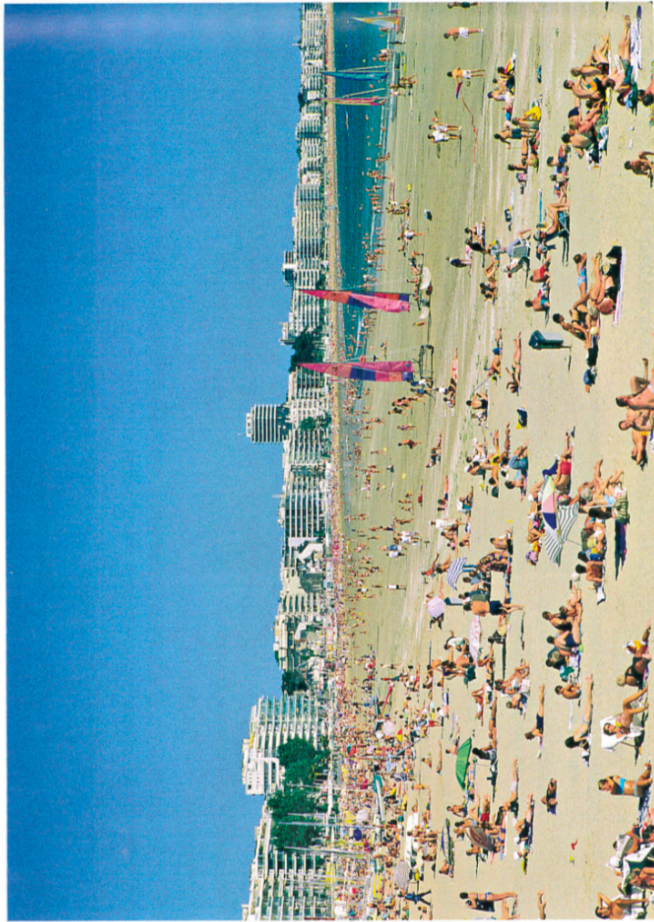
La Baule en été (Loire-Atlantique).