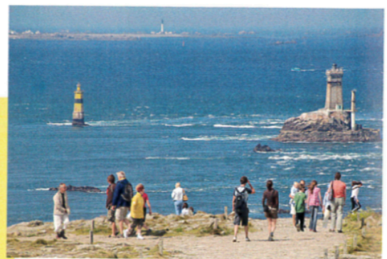
Touristes à la pointe du Raz (Finistère).

Bernard et Renée Kayser, La France expliquée aux enfants , © Éditions Gallimard Jeunesse, 2011.