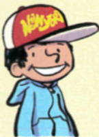
Achille (enfant du village)

Avec le nouveau parc, l'été, nous allons manquer d'eau pour nos champs. Je suis contre ce projet.