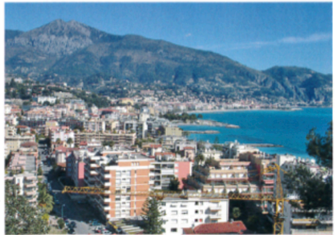
Photographie de la baie de Menton en 2007.

Le tourisme est une activité très ancienne à Menton. Cette ville possède de nombreux atouts pour attirer les touristes : sa situation en bord de mer, son climat, la beauté de son cadre naturel, la richesse de son patrimoine et les manifestations organisées par la mairie, comme la fête du Citron. ↴