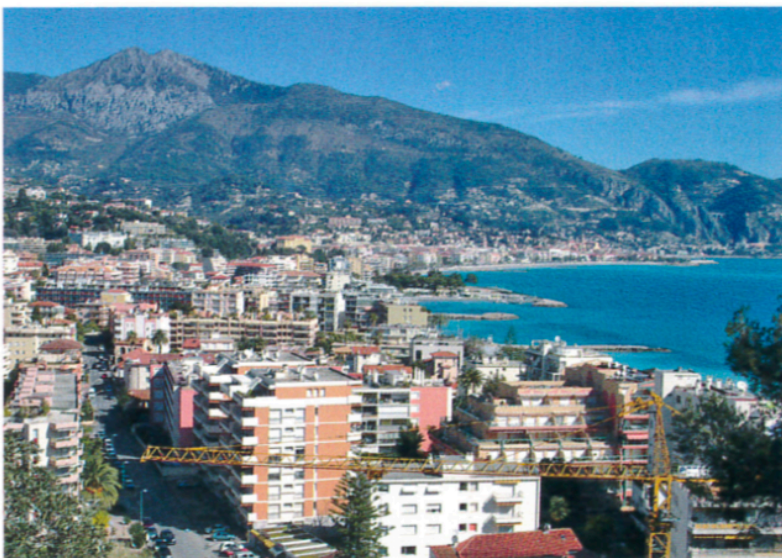
b. Photographie de la baie de Menton prise en 2007.