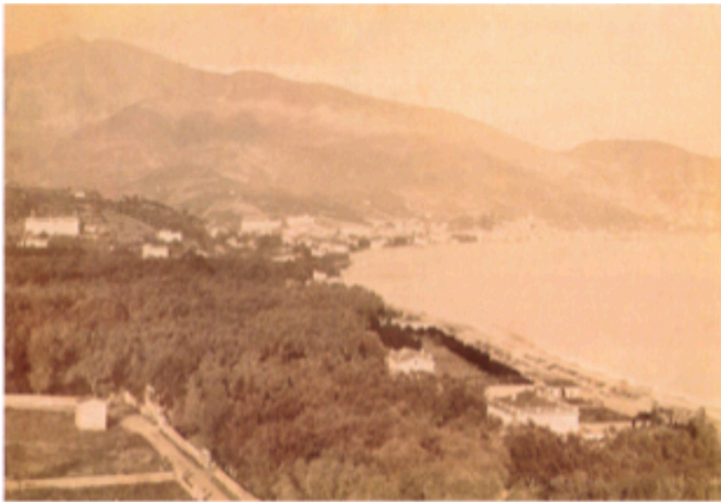
Photographie de la baie de Menton en 1893.

Géo 22 Pourquoi le tourisme est important à Menton ?