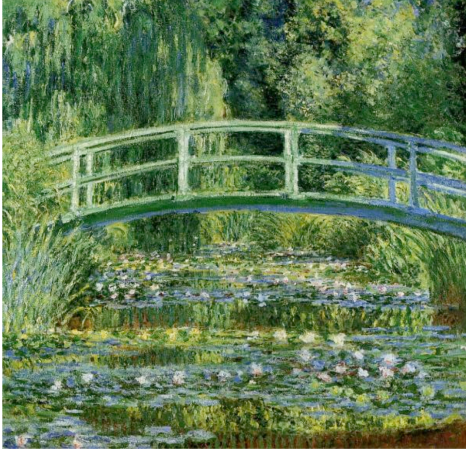
Le bassin aux nymphéas de C. Monet