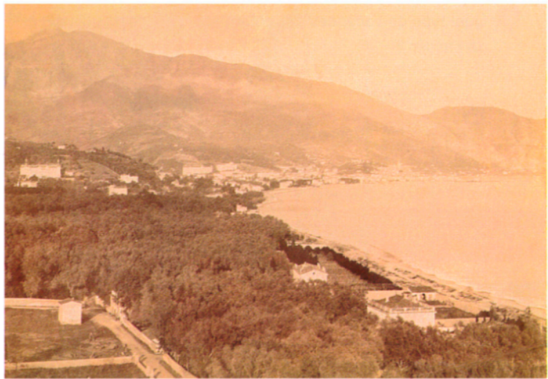
a. Photographie de la baie* de Menton prise en 1893.