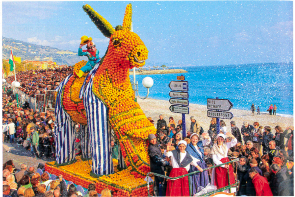
En 2015, le défilé de la 82 e édition de la fête du Citron a réuni 27 000 spectateurs, presque autant que d'habitants dans la ville.