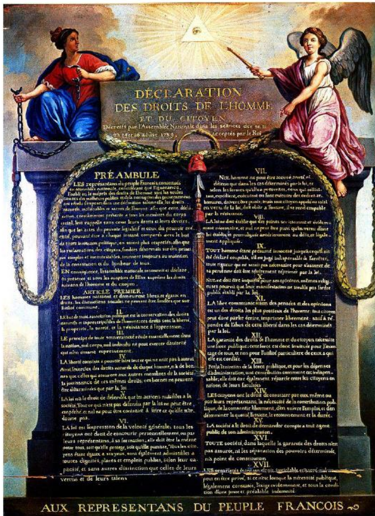
Déclaration des droits de l'Homme et du citoyen, 26 août 1789