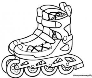
Patins à roulettes