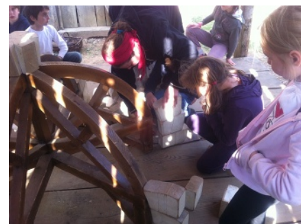
Puis on a commencé à poser le voussoir.