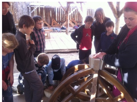
On a commencé par poser la clé de voûte.