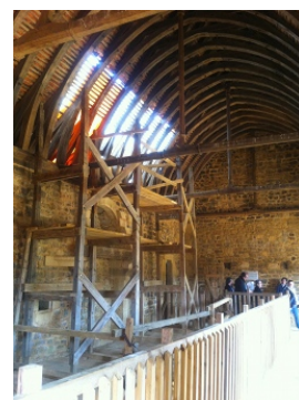
Alix et Rose

Le chantier est réalisé sur une ancienne carrière boisée. Depuis le début, le chantier a beaucoup avancé : la tour de la chapelle et les courtines ont pris forme. Le logis seigneurial et la voûte de la tour maîtresse sont achevés. 45 ouvriers travaillent sur ce chantier, en respectant les techniques du XIIIème siècle.