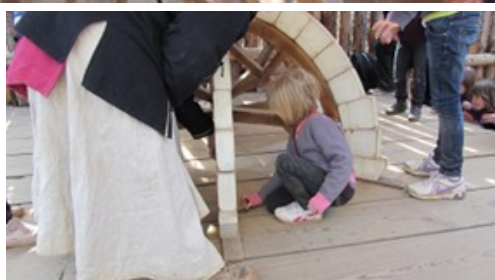
Gwendoline est en train d'enlever une petite plaque pour voir si la voûte tient seule!