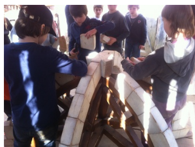
Chaque élève a participé.

Les élèves ont pu participer à un atelier pour comprendre comment sont construites les voûtes à croisée d'ogive. Cette voûte est constituée de 6 nervures en pierre calcaire réunies et verrouillées en leur centre par une clé de voûte. Après avoir construit un gabarit en bois, les maçons commencent par poser la clé de voûte, puis les culots sur le pourtour de la pièce à couvrir, ensuite ils posent les sommiers, les contre-sommiers et le premier voussoir. Ils posent ensuite toutes les pierres, les cimentent et retirent le gabarit. Nous avons pu faire presque comme eux et notre voûte tenait parfaitement.