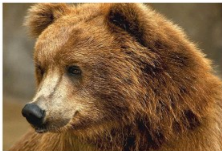
ours de Gobi