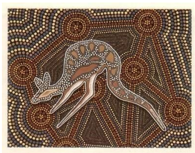
Aboriginal Dreamtime art