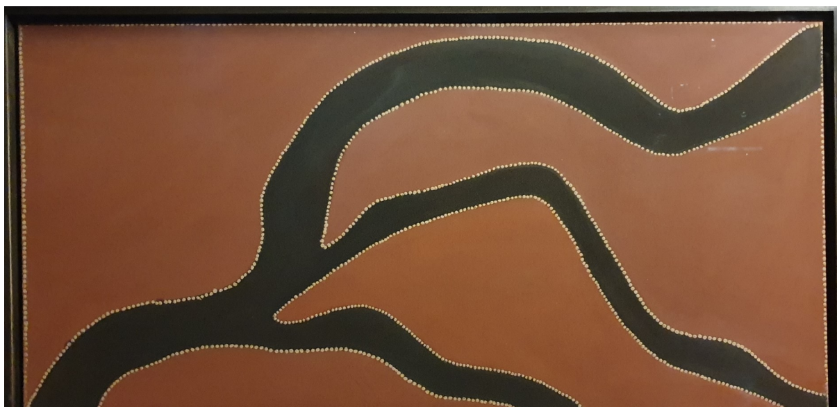
Tableau aborigène, Musée du Quai Branly