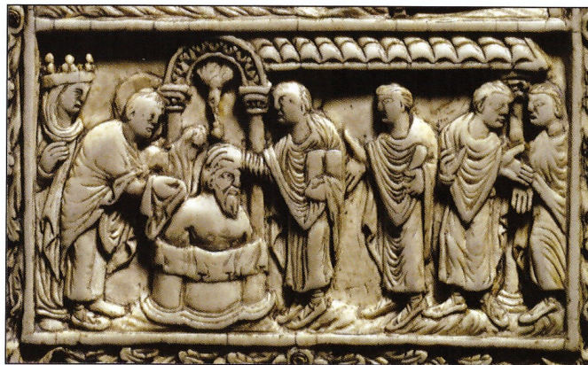
BAPTÊME DE CLOVIS à Reims le 25 décembre 496. Bas-relief en ivoire du IX e siècle.