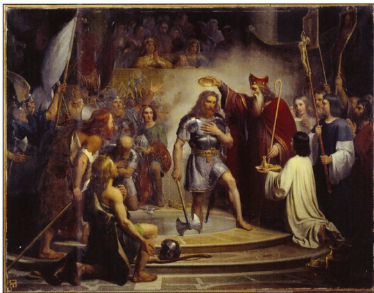
BAPTÊME DE CLOVIS à Reims le 25 décembre 496 Peinture de François Louis Dejuine, 1837.