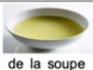
de la soupe