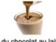
du chocolat au lait