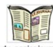
du papier journal