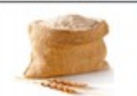
de la farine