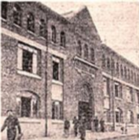
LA CATHÉDRALE DE REIMS, LE LIEU DE LA SIGNEDITION

C'est dans la nuit du 7 au 8 mai 1945 que les forces armées allemandes ont signé la reddition sans conditionnelle à l'Armée rouge et à l'Armée américaine. Cette signature a eu lieu à Reims, dans la cathédrale, à 2 heures 41 minutes. Le commandant en chef des forces allemandes en Tchécoslovaquie ne reconnaît pas la capitulation. Tout le reste des forces allemandes en Tchécoslovaquie a été déclaré hors de combat. Le commandant en chef des forces allemandes en Tchécoslovaquie ne reconnaît pas la capitulation. Tout le reste des forces allemandes en Tchécoslovaquie a été déclaré hors de combat.