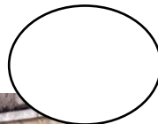
La reggia di Caserta