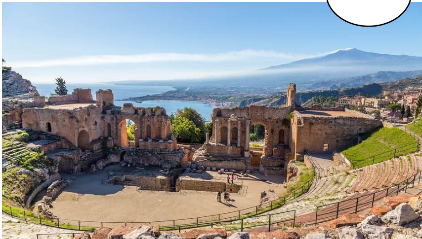
Il teatro greco