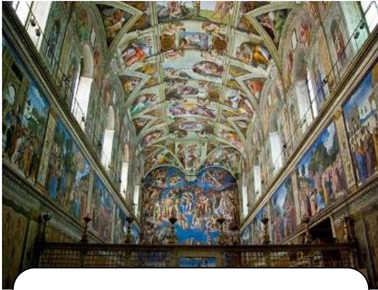
LA CAPPELLA SISTINA