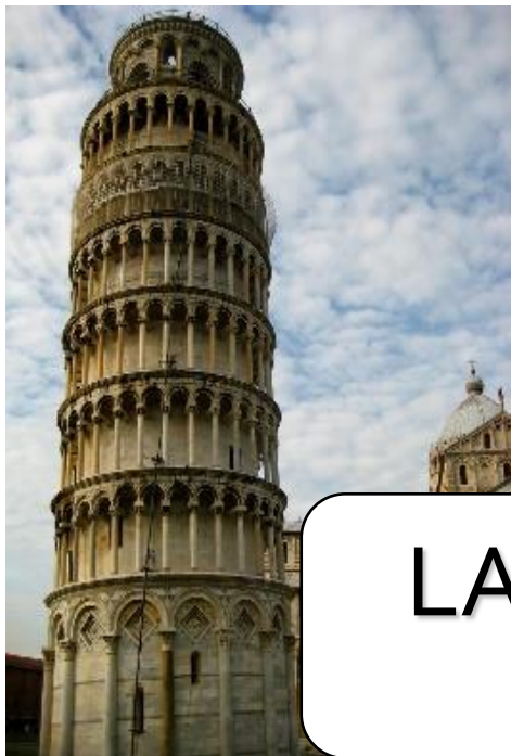
LA TORRE DI PISA