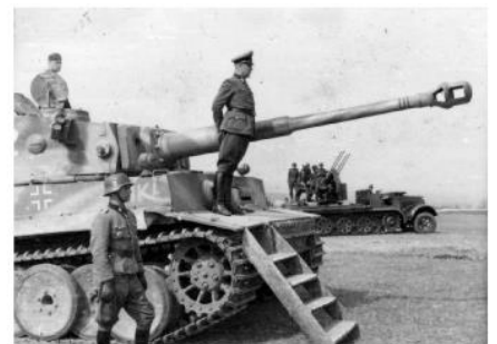
Soldats allemands sur le front de l'Est, 1943