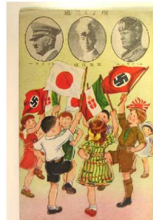
Document de propagande Carte postale publiée au Japon en 1938