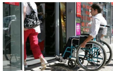
Entrée d'une médiathèque accessible aux personnes à mobilité réduite.

L'écoquartier est aussi aménagé pour permettre l' accessibilité aux personnes à mobilité réduite. Souvent, l'écoquartier propose aussi des logements adaptés aux personnes handicapées.