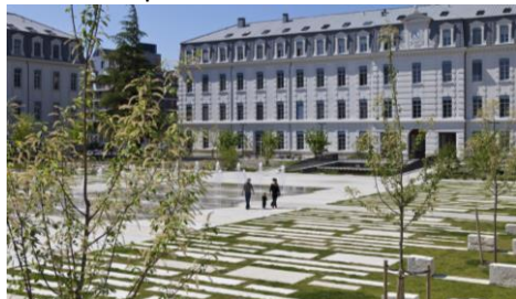
ZAC de Bonne à Grenoble.

Les écoquartiers encouragent les habitants à s'organiser et à discuter ensemble de la vie du quartier. Les espaces communs permettent de se rencontrer.