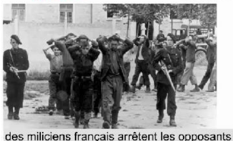
des miliciens français arrêtent les opposants