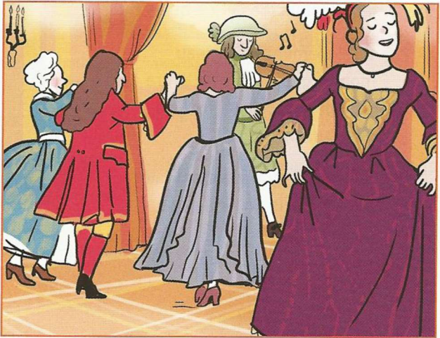
d. Trois soirs par semaine, de 19 h 00 à 22 h 00, le roi reçoit les courtisans pour des divertissements (danse, concert, théâtre).

À quelle heure le roi se lève-t-il ? _____