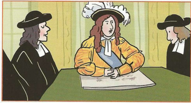
b. À 11 h 00, le roi réunit le Conseil : il recueille les avis de ses ministres mais prend ses décisions lui-même.