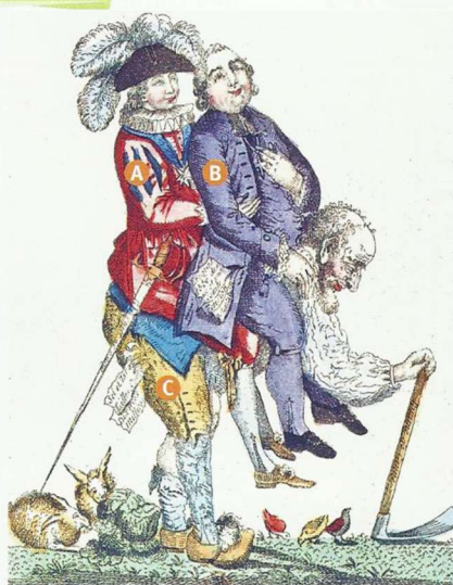
a. Gravure colorisée anonyme, mai 1789 (Bibliothèque nationale de France, Paris).