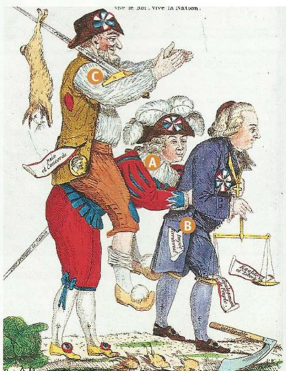
b. Gravure colorisée anonyme, août 1789.

A la noblesse B le clergé C le tiers état