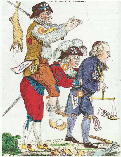
b. Gravure colorisée anonyme, août 1789 (Bibliothèque nationale de France, Paris).

A la noblesse B le clergé C le tiers état