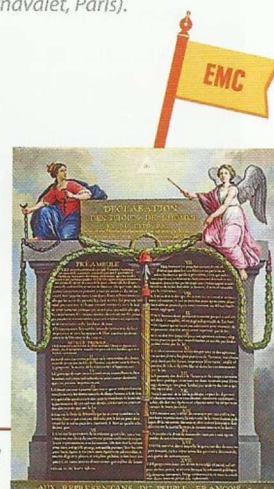
Peinture anonyme, XVIII e siècle (musée Carnavalet, Paris).

Vote de la Déclaration des droits de l'homme et du citoyen