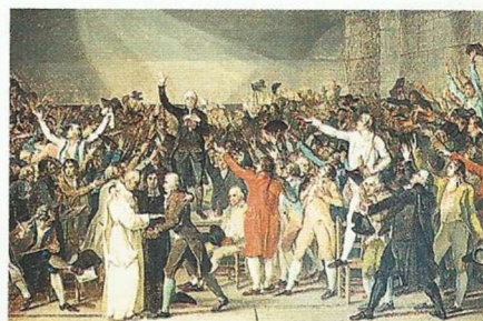
Peinture de Jacques-Louis David, XVIII e siècle (musée Carnavalet, Paris).

Les députés du tiers état (et des députés de la noblesse et du clergé) font le serment de ne pas se séparer avant d'avoir rédigé une Constitution.