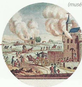
Gravure anonyme, XVIII e siècle (musée Carnavalet, Paris).