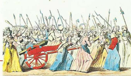
Gravure anonyme, XVIII e siècle (musée Carnavalet, Paris).

Furieuses de l'augmentation du prix du pain, des Parisiennes se rendent à Versailles et ramènent le roi à Paris.