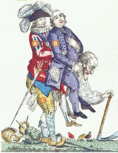
a. Gravure colorisée anonyme, mai 1789 (Bibliothèque nationale de France, Paris).