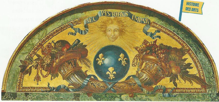
Peinture réalisée en 1672 par Louis XIV sur un plafond du château de Versailles. L'inscription en latin sur la banderole « NEC PLURIBUS IMPAR » signifie « Au-dessus de tous ».