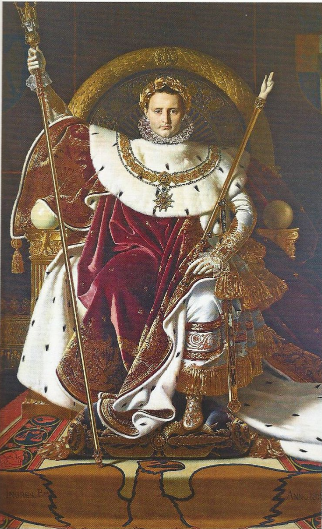
Peinture de Jean-Auguste Dominique Ingres, Napoléon I er sur le trône impérial , 1806, hauteur 2,59 m, largeur 1,62 m (musée de l'Armée, Paris).

Quand la République est-elle proclamée ?