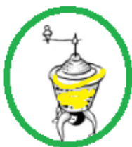
un moulin à légumes