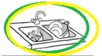
un évier à vaisselle