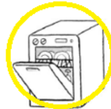
un lave vaisselle