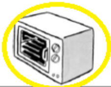
un four à micro-ondes