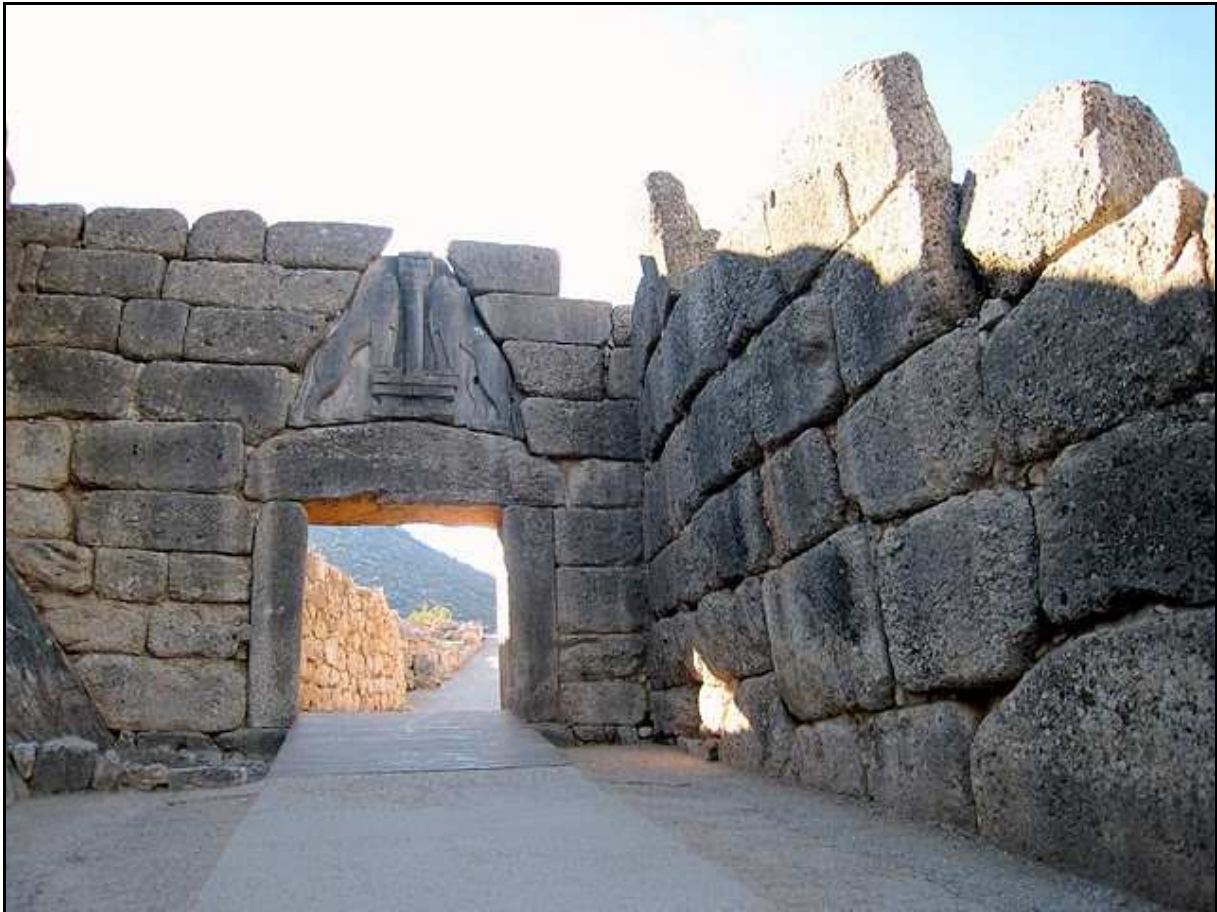
Document 2 – La Porte des Lionnes.