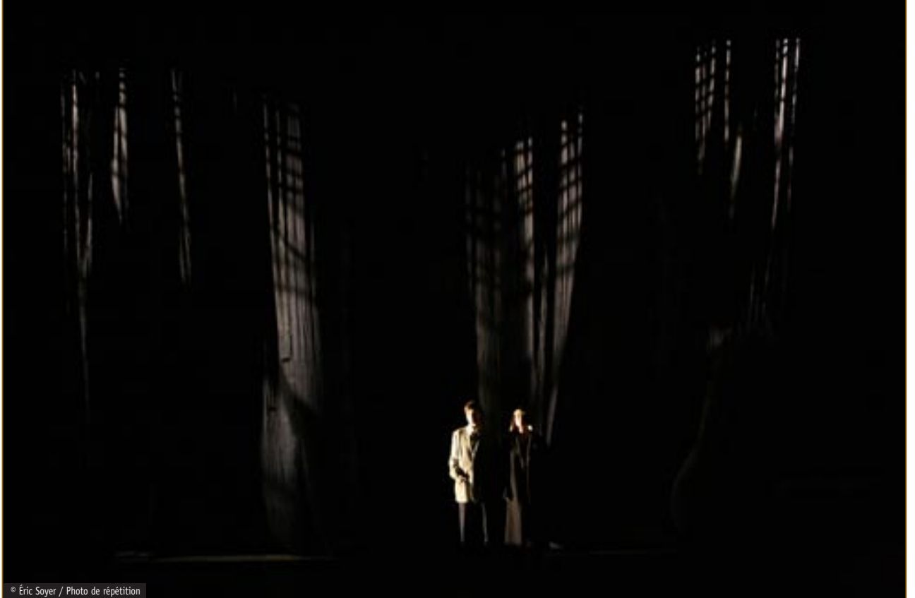
Photo de répétition

« sorte de monstre laid, si laid qu'il ressemblait à un monstre marin ». Le pantin de bois, jouet de ces êtres terrifiants, connaît aussi des peurs et des souffrances effroyables : la douleur de la faim, la nuit, l'orage, la prison, la pendaison, la tempête, le ventre du requin. Le poème de Joël Pommerat, débarrassé de nombreux personnages, ne fait pas moins peur que le texte traditionnel.