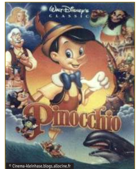
Affiche du film d'animation Pinocchio de Walt Disney pour sa sortie en 1940