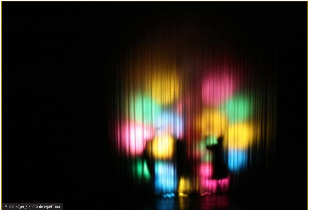
Pinocchio transformé en âne. Répétition du spectacle de Joël Pommerat