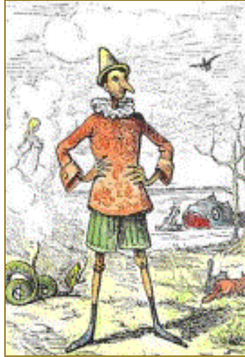
Illustration d'Enrico Mazzanti pour la première édition de Pinocchio , Paggi, Florence, 1883

– Mais pour bien aller à l'école, il me faut quelques vêtements.