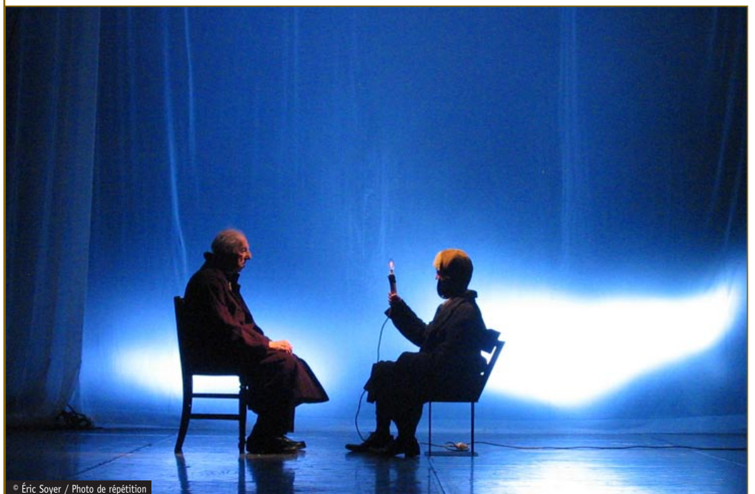
© Éric Soyer / Photo de répétition