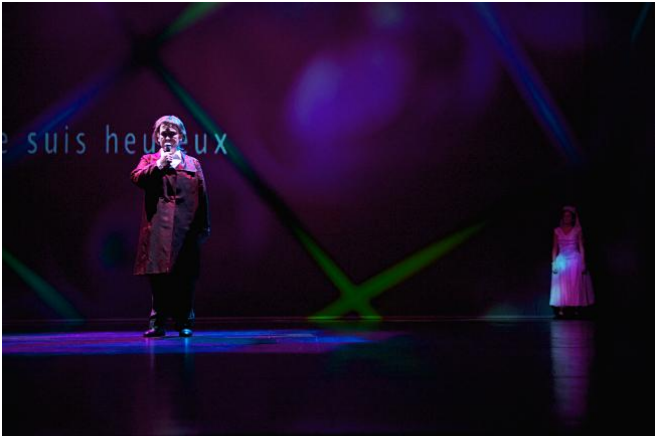
Document 3 : Cendrillon , mise en scène de Joël Pommerat (deuxième partie, scène 7)