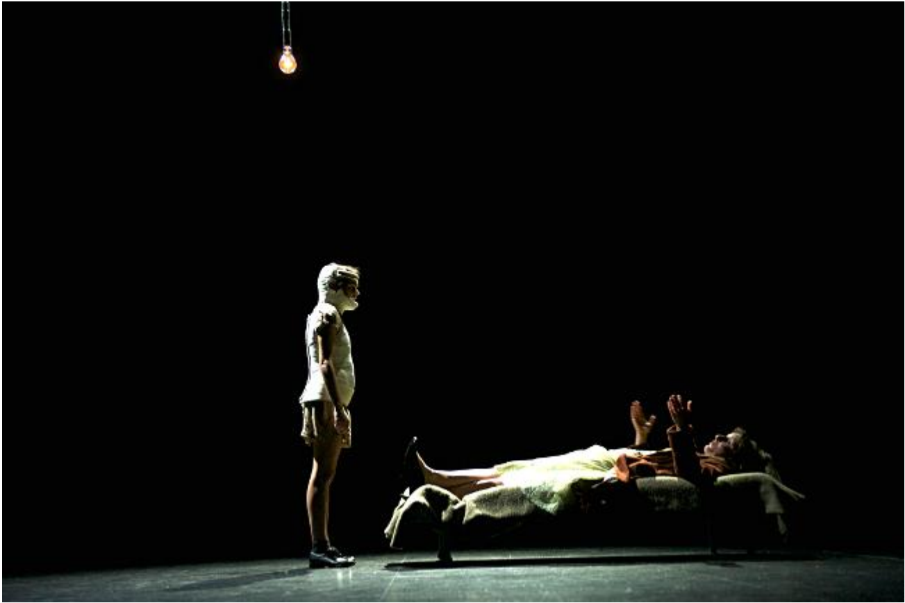
Document 2 : Cendrillon , mise en scène de Joël Pommerat (première partie, scène 13)