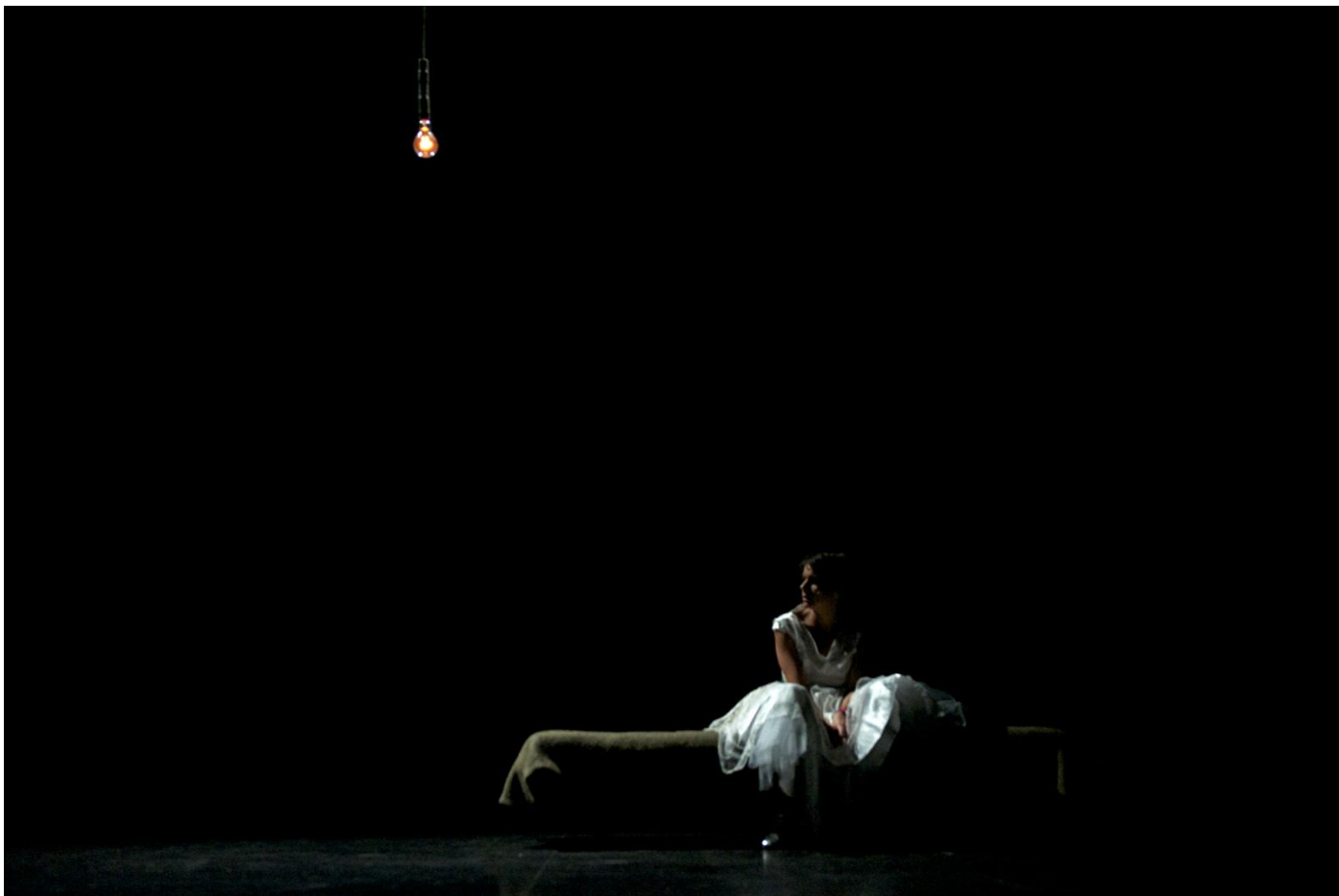
Document 4 : Cendrillon , mise en scène de Joël Pommerat (deuxième partie, scène 11)