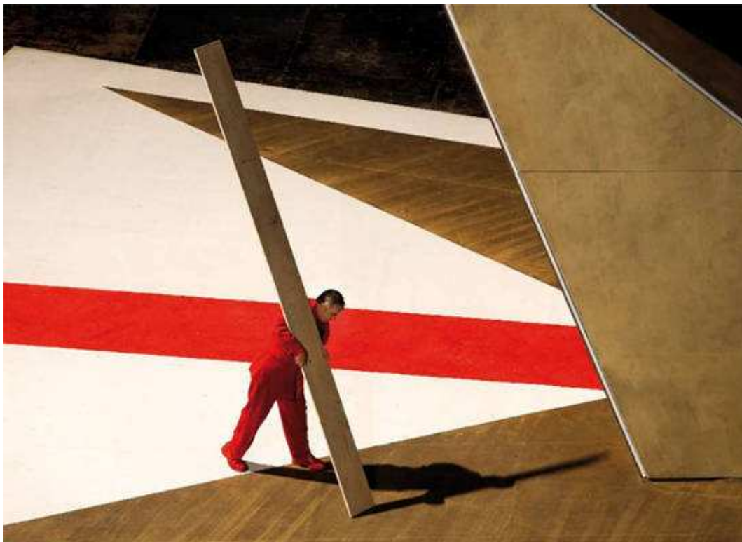
L'Acte Inconnu , Valère Novarina, Avignon 2007,