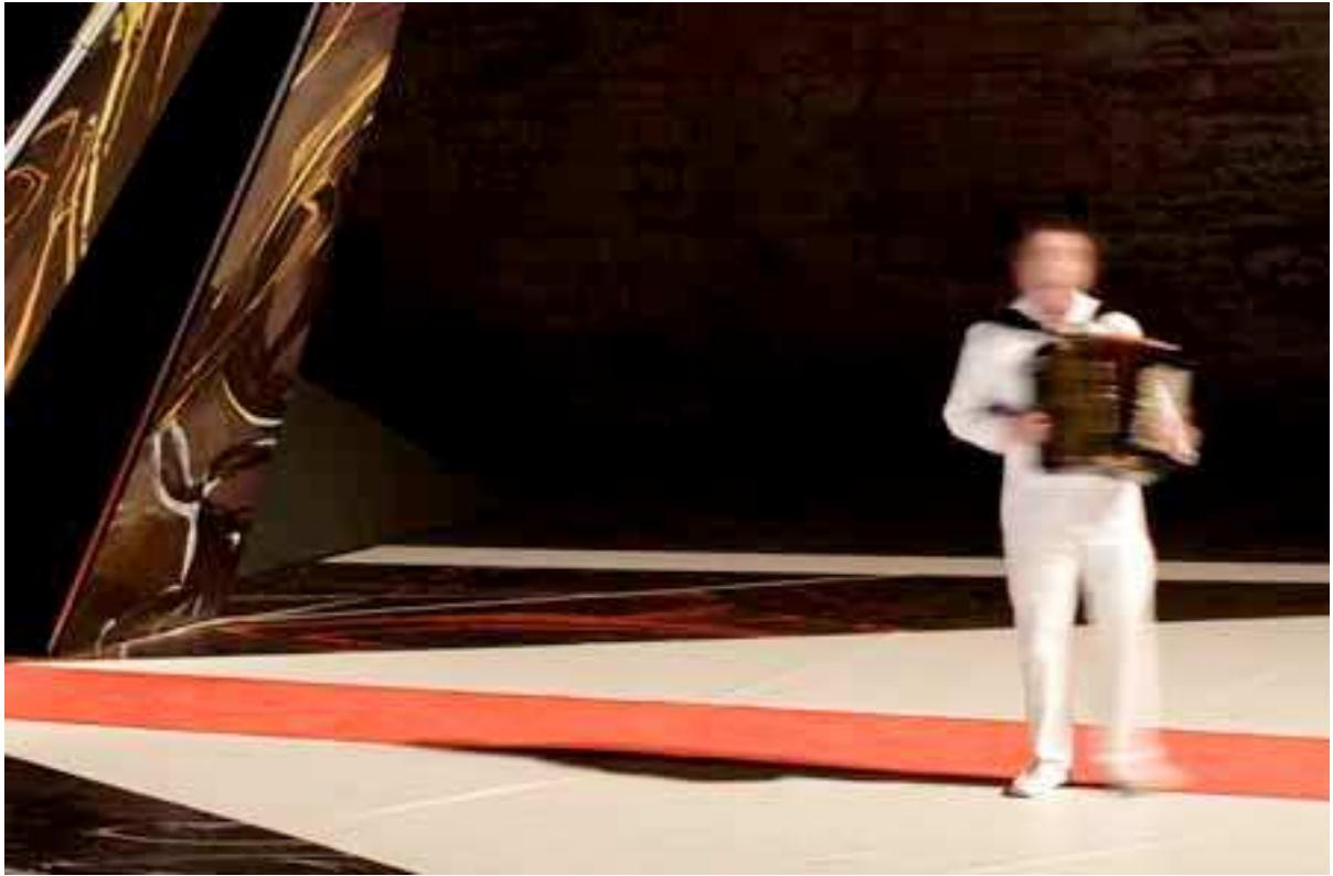
L'Acte Inconnu , Valère Novarina, Avignon 2007,