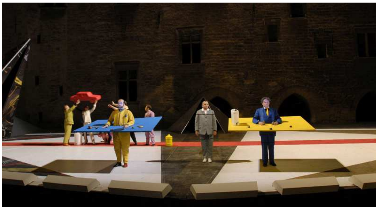
L'Acte Inconnu , Valère Novarina, Avignon 2007