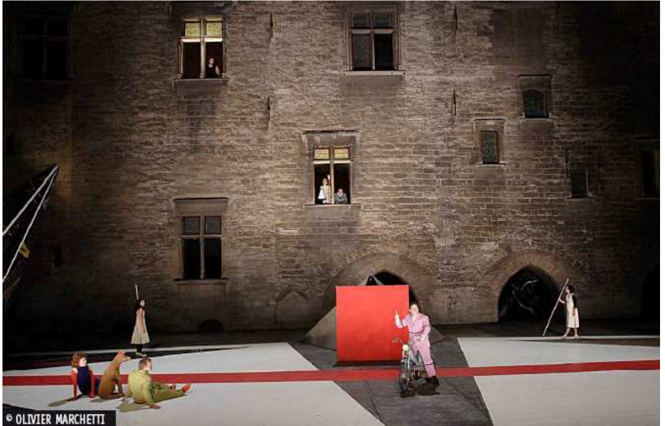
L'Acte Inconnu , Valère Novarina, Avignon 2007, photo tirée de Pièce (Dé)montée n°24, juillet, septembre 2007.