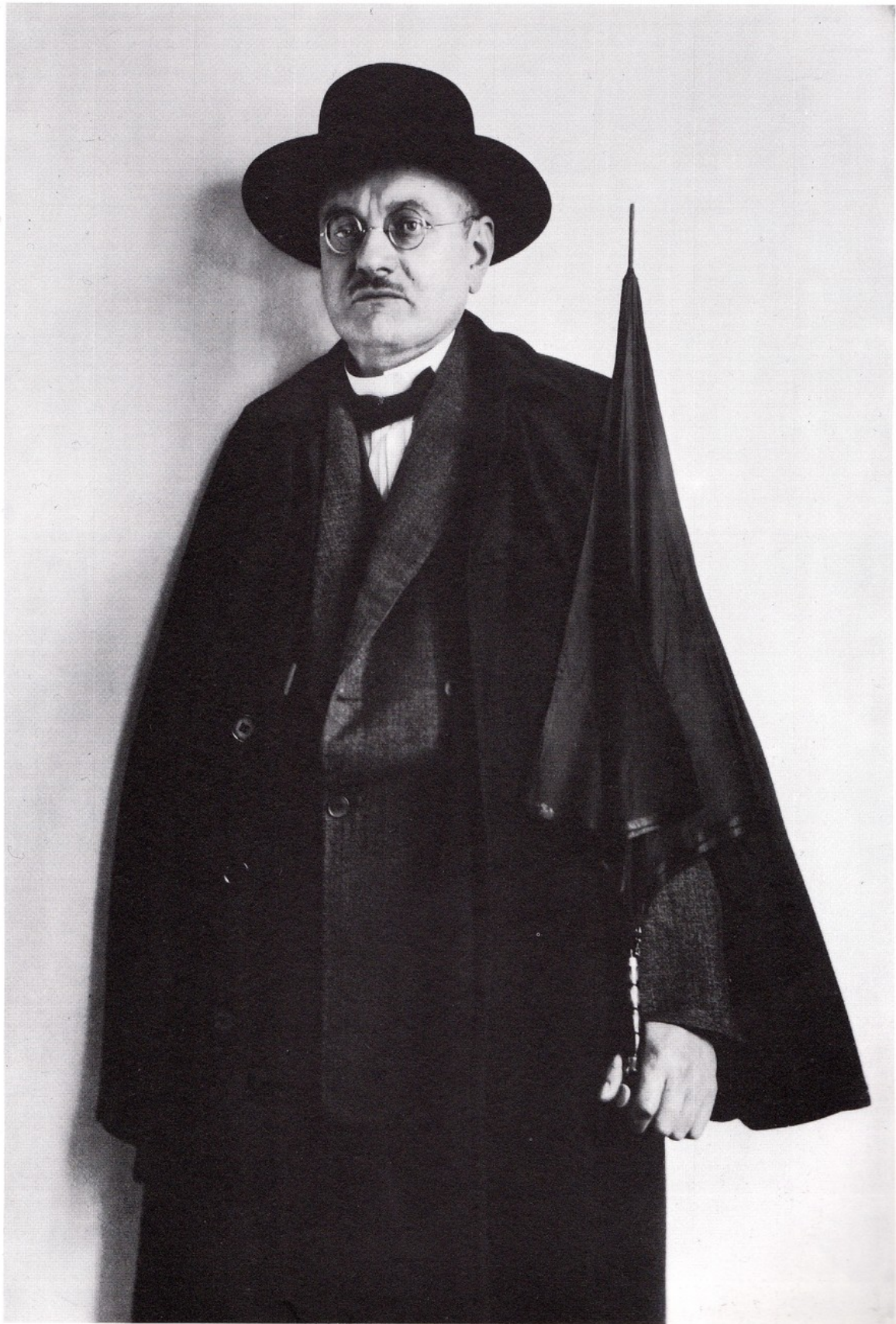
88 August Sander, Parliamentarian , 1928 Museum Ludwig, Cologne

Document 1 : August Sander, Parliamentiaren (Parlementaire), 1928, Musée Ludwig, Cologne