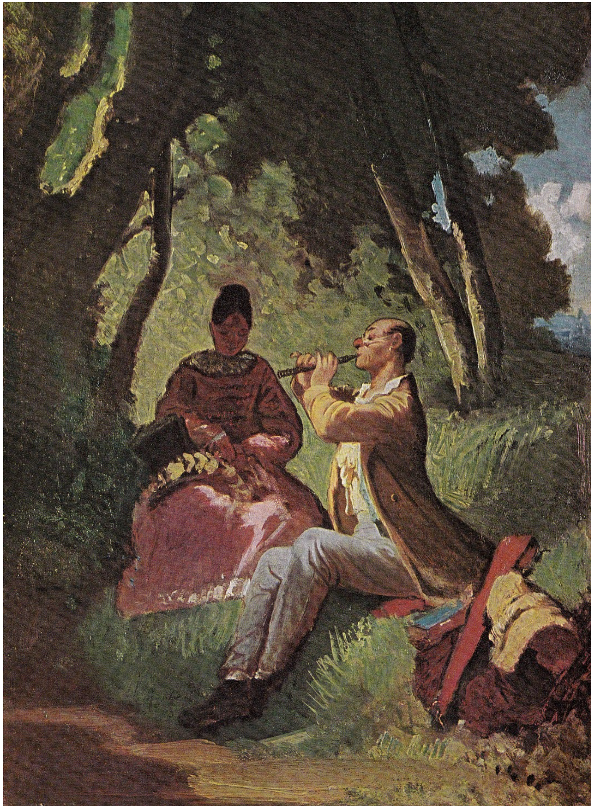
Document 2 : Carl Spitzwegs, Das Flötenkonzert 1860 huile sur toile 37,5 30 page 91 Carl Spitzwegs Manuel Albrecht Schuler 1980 Stuttgart