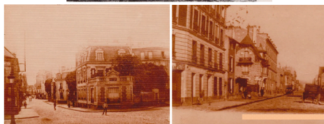
Plaquette photos d'Argenteuil autrefois