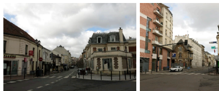
Plaquette photos d'Argenteuil aujourd'hui