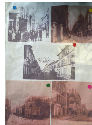
Plaquette photos d'Argenteuil autrefois à avec placement des gommettes