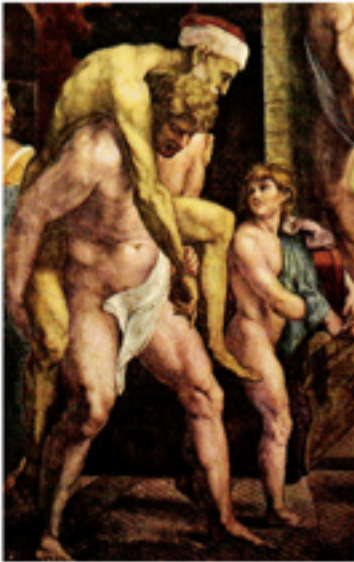
Raphaël - L'Incendie du Borgo Chambres de Raphaël, Vatican (Rome)