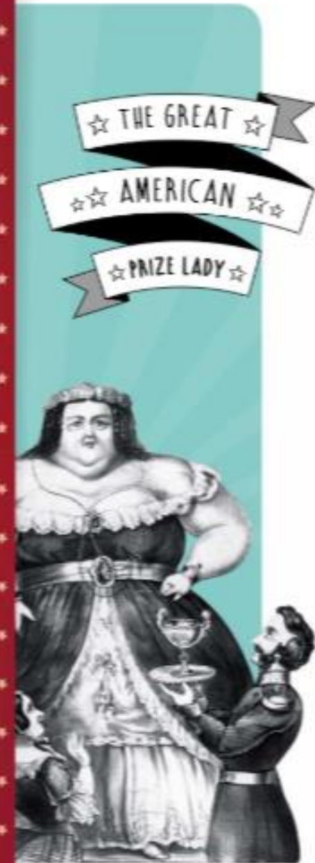
Poster to advertise a freak show, 1868